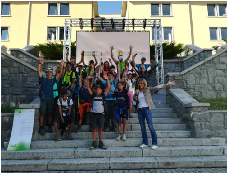
I ragazzi a Cogne

Nove anni di trekking in Inglese alla scoperta del Parco Nazionale Gran Paradiso